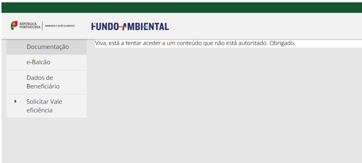
Figura 4 –Área reservada do utilizador Beneficiário

Após introduzir as suas credenciais de acesso irá surgir o seguinte ecrã: