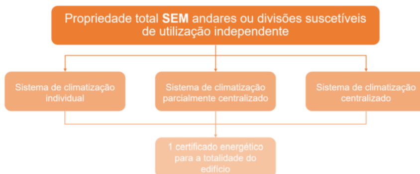
Figura 2 – Objeto de certificação – Edifícios de Comércio e Serviços (caso 1)