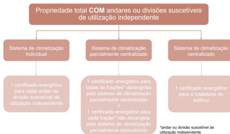
Figura 3 – Objeto de certificação – Edifícios de Comércio e Serviços (caso 2)