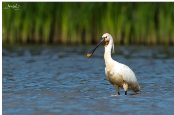
Figura 3 – Fotos de algumas das aves presentes no Paul de Manique, 2019.