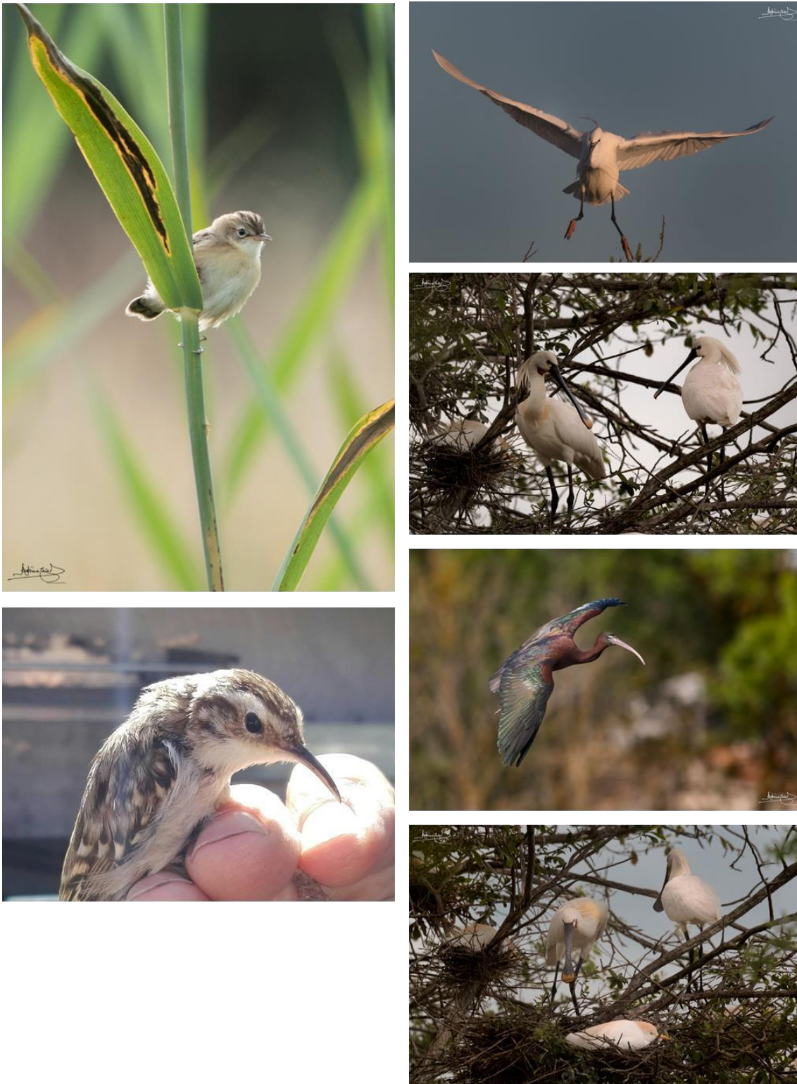
Figura 3 – Fotos de algumas das aves presentes no Paul de Manique, 2019.