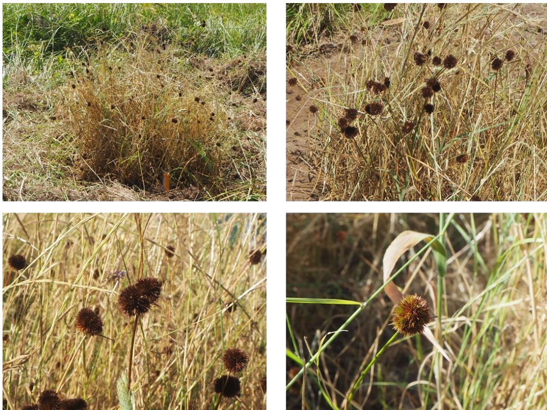
Figura 1 – Juncus Valvatus identificado no mês de Junho de 2019, no Paul de Manique do Intendente, espécie com estatuto de protecção contemplada pela Directiva Habitats.

No que diz respeito ao Critério B1 (Criatividade/soluções e abordagens) , foi atribuída a pontuação de 3 pontos (Tabela 3), tendo sido considerado que “O projeto apresenta uma abordagem já conhecida mas introduz alguma novidade”. Considera-se que deveria ter sido atribuída pontuação mais elevada, tendo em conta o carácter da estratégica integradora e multidisciplinar que se pretende alcançar durante e após o término de 2019. Neste contexto, tal como referido na Memória Descritiva, para além das acções conducentes ao aumento do conhecimento científico da área em apreço (Acção 1, 2, 3 e 4), aposta-se na promoção do reconhecimento do valor do património natural (Acções 5 a 14), com especial destaque para a Formação/capacitação (professores - Acção 13) (comunidade: alunos - CIMLT/alunos - UTICA/séniiores voluntários – Acção 14), vão ser desenvolvidas acções com um público muito diversificado, quer em idade, quer em nível de