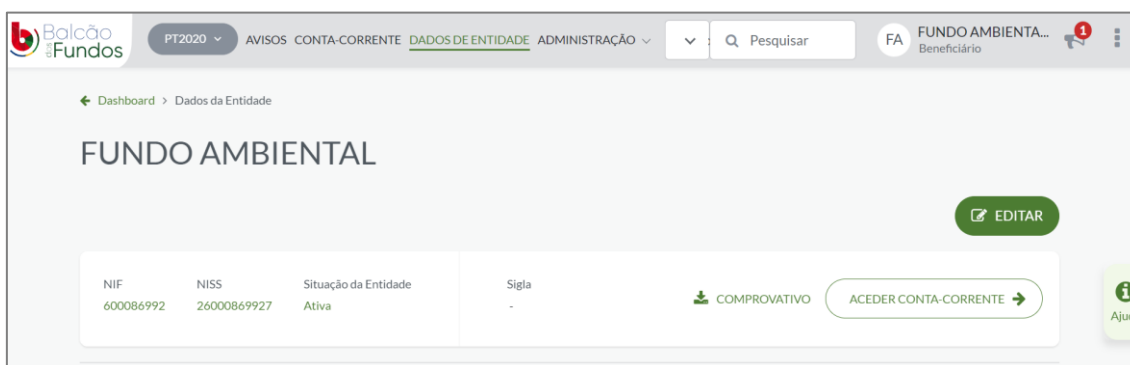
Figura 1 – Página do Balcão dos Fundos onde se pode obter o comprovativo de registo.

Para obter o Comprovativo de Registo no Balcão dos Fundos, deverá clicar no separador “Dados de entidade”, e posteriormente clicar onde diz “Comprovativo” (figura 1).